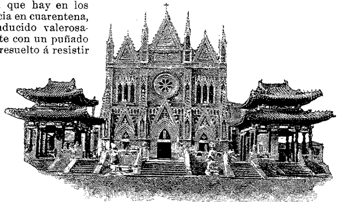
FACHADA DE LA CATEDRAL DE PEKIN QUE INTENTARON INCENDIAR LOS BOXERS

El prelado que rige la diócesis católica de Pekin es monseñor Alfonso Favier, de nacionalidad francesa, y pertenece á la Congregación de Padres lazaristas. En él resplandecen las virtudes del varón evangélico, á la par que las dotes de un caballero de mundo. Propagandista acérrimo, orador elocuentísimo y escritor infatigable, es al mismo tiempo arquitecto muy distinguido. Al P. Favier estuvo confiada la construcción de la casa-legación de España, que es una de las más bellas edificaciones de Pekin, así como el ilustre constructor una de las figuras más sobresalientes de la sociedad europea en la capital del imperio.