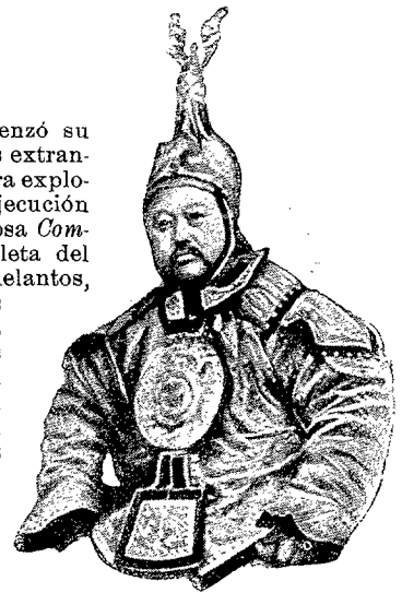
COMANDANTE CHINO DEL FUERTE DE TA-KU

En una de las alternativas de la guerra chino-japonesa cayó en desgracia, siendo destituido, degradado de todos sus honores y encausado. Pero una vez hecha la paz, el Gobierno pronto hubo de reconocer que, si se habían de mantener buenas relaciones con las potencias extranjeras, Li-Hung-Chang era un hombre absolutamente necesario, y en tal concepto fué destinado de virrey á Cantón. El telégrafo nos anuncia que ha sido