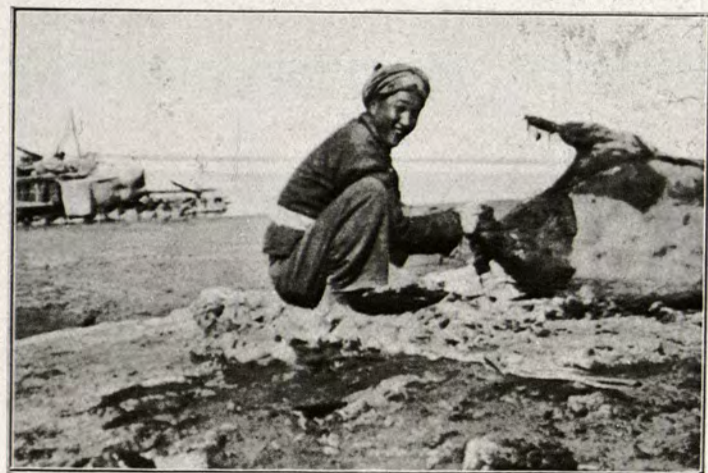
Els indígenes transporten llurs bótes de vi o d'oli damunt les aigües del riu