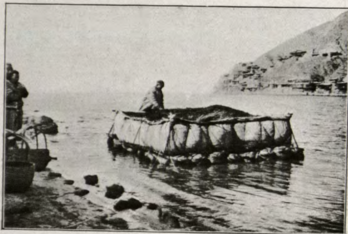
Una de les pintoresques embarcacions que construeixen els indígenes per navegar damunt el riu Groc