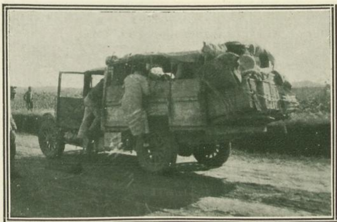
El «expreso» de las eternas paradas.