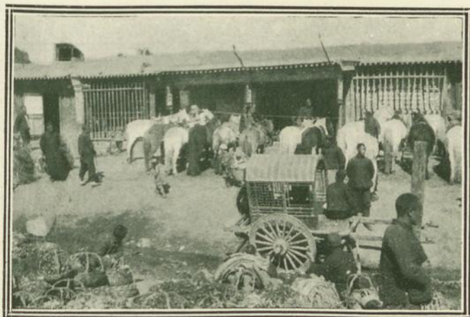
Posada de Miyunshien.